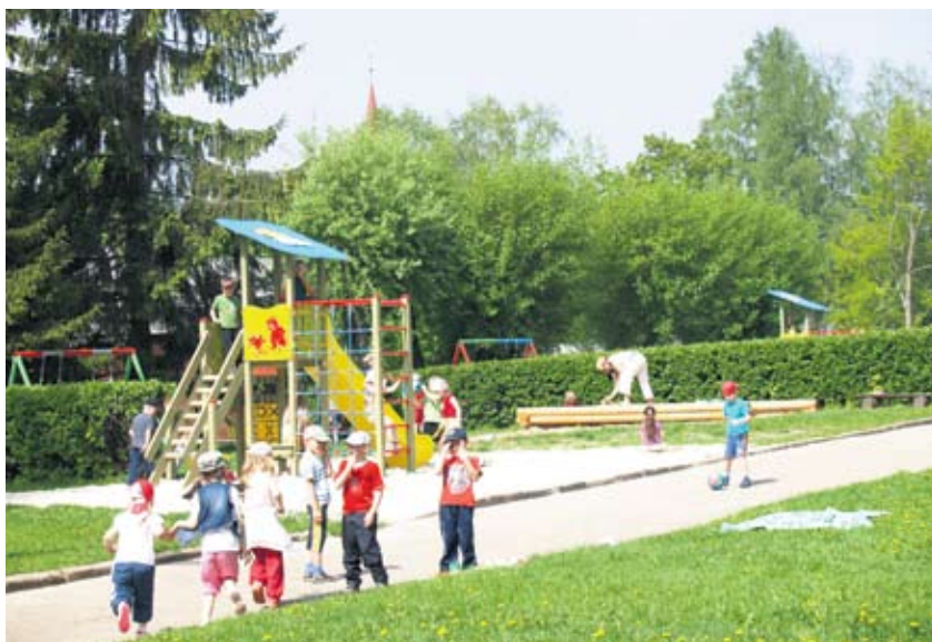
Lasteaia Walko mudilased mänguväljakul.

Hästi on lasteaiadadel õnnestunud Keskkonnainvesteeringute Keskusele (KIK) kirjutatud projektid, tänu millele said lapsed käia ekskursioonidel Pokumaal, Karula rahvusparkis, Elistvere loomaparkis, lodjasõidul Väike-Emajõe, mitmes loodusmuuseumis ja mujalgi. Kõik sellised käigud rikastavad laste sisemaailma ja annavad õpet-