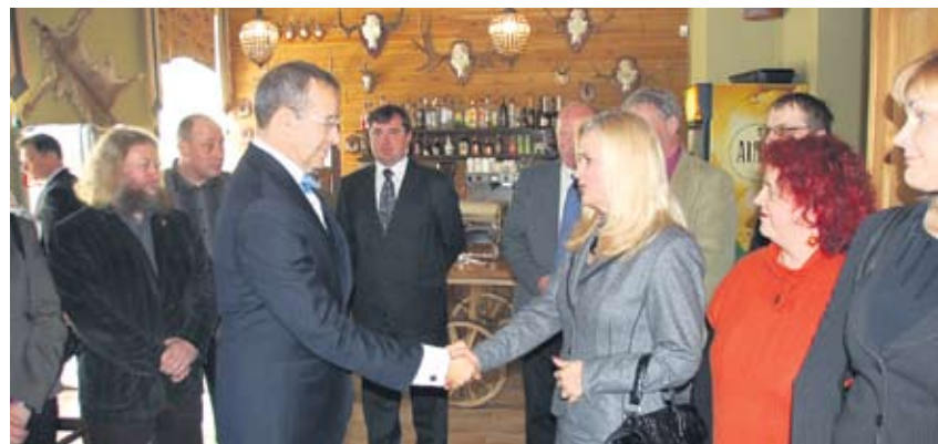
Hr Ilves kohtub Valgas äriklubi liikmetega.