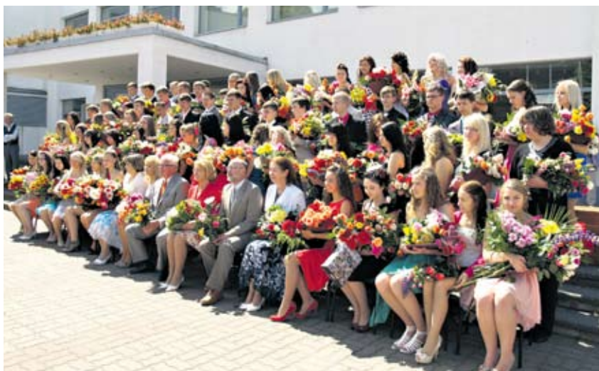
20. juunil 2012 lõpetas Valga Gümnaasiumi 9. klassi viimane lend.

Esimesel septembril kell 10.00 alustab Valga Gümnaasium võrreldes harjumuspärasega üsna väikese koolina. Lahutus on toimunud ja põhikooliastme õpilased Valga Põhikoolile üle antud. Samuti on toimunud muudatused õpetajate osas. Kuivõrd väikeses koolis ei jagu enam koormust kõigile,