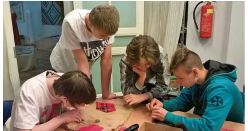
Мастерская по изготовлению сумок для покупок, Валгаская основная школа.

Во второй половине учебного дня группы поменялись местами.