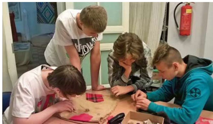
Poekottide valmistamise töötuba Valga põhikoolis.

Ettepanekud võib saata ka elektroonselt aadressil valgalv@valgalv.ee