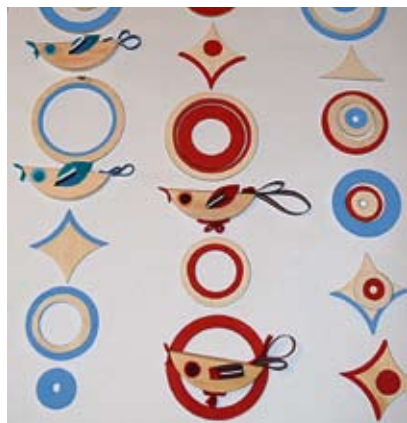
Näidised motiividest, millega ehitakse kuusk, teised, samblast motiivid olid pildistamise ajal just pressi all. Kunstikool ehib kuuse ülemise osa, alumise osa aga ministrid kunstikooli ette valmistatud õpitoas.

Kooli tegemisi on märganud nii Eestis kui ka Lätimaal — suureks tunnustuseks on Läti Vabariigi presidendi usaldus, ta tegi sel sügisel kunstikoolile ettepaneku tulla Riiga, kaunistama presidendi jõulukuuske.