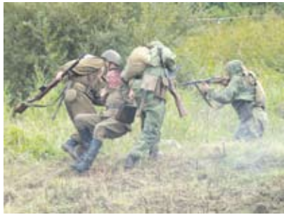
Rahvusvaheline Valga Militaarfestival tunnustati Valgamaa ja Lõuna-Eesti turismi aastakonverentsidel 2011. aasta parimaks sündmuseks.