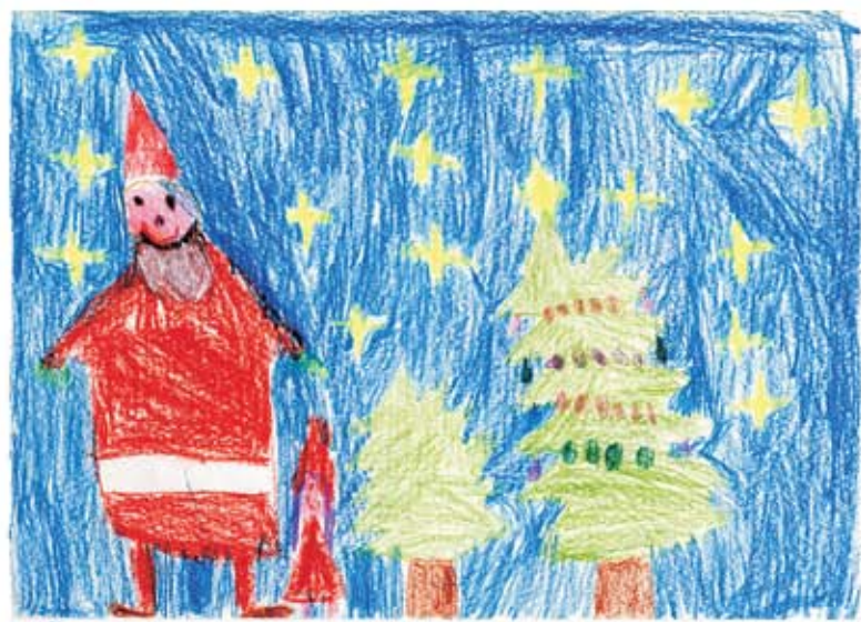
"JÖULUAEG" ELIZABETH 6A