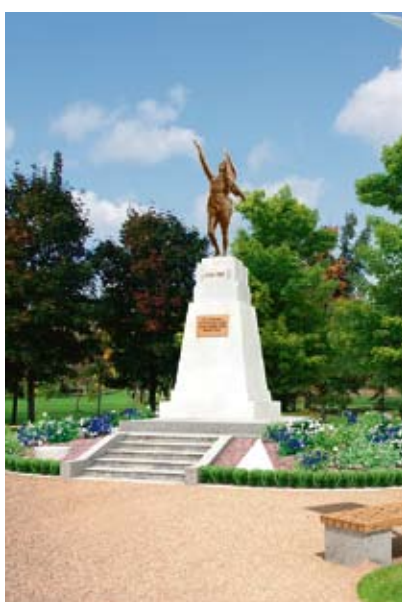
V rahvusvahelise Valga Militaarjaloo Festivali ajal taasavatakse Vabadussõja Valga vabadussammas.