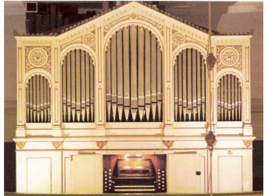
Valga Jaani kiriku orel. Friedrich Ladegast 1867.

toid tehakse peaaegu tasuta — et saaks näha, kuulda ning nii-öelda katsuda üht ajaloolist oreli.