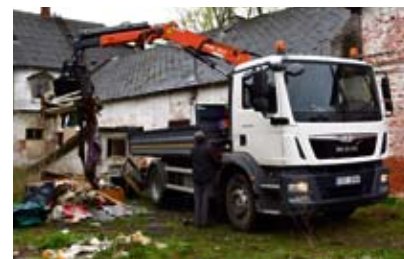
Новый грузовой автомобиль Man за работой по уборке.

Автомобиль был укомплектован выигравшей конкурс госпоставки эстонской фирмой Keil M.A. OÜ. Грузовик MAN TGM 15.250 с шасси (без кузова, базовый автомобиль) гидравлический подъемник ATLAS, 350-литровый грейферный ковш Kinshofer, а также малый грейферный ковш и захват для деревьев произведены в Германии. Надстройку — кузов и дополнительные опоры — изготовили и установили вместе с подъемником в Эстонии.