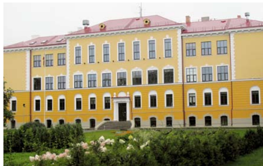
Valkas ģimnāzijas jaunais veidols — kopš 2014. gada oktobra.

skolēniem un skolotājiem, arī bijušajiem VĢ skolotājiem