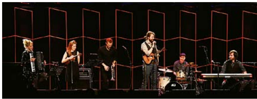
Festivalil Borderrock astub teiste seas üles ka populaarne bänd Odd Hugo Tartust.

5. ja 6. juunil toimub kaksiklinna Valga–Valka sünnipäevanädala raames eestlaste ja lätlaste ühisfestival Borderrock, mis leiab aset Valka laululaval. Suvehooaja esimesel rokifestivalil esinevad artistid Lätist, Eestist ja Leedust.