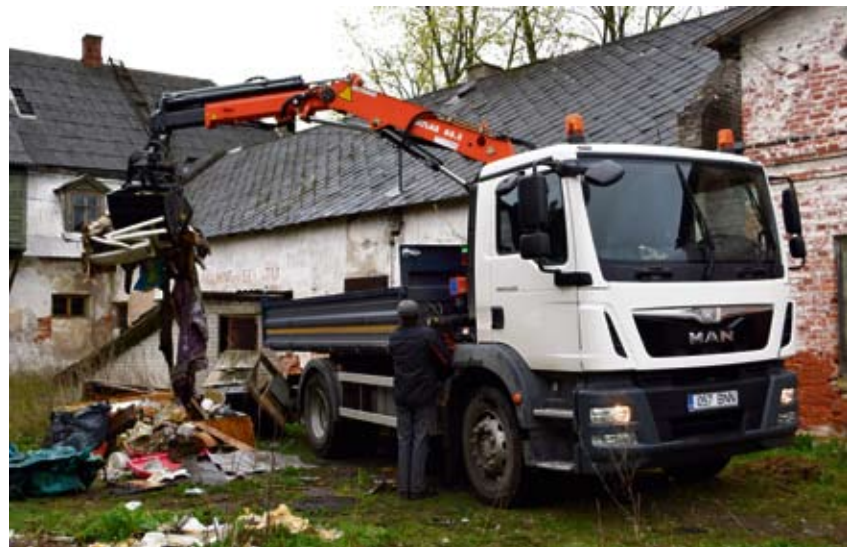
Uus veoauto Man tööhoos talgupäeval.

Oluline on ka autojuhi töötingimuste ja tööohutuse paranemine: auto kabiinis on kliimaseade, kabiin on varustatud erinevate taha- ja allavaa-