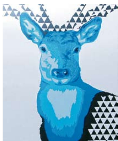
Grafiti meistriklassi juhendaja Dainis Rudens'i teos.