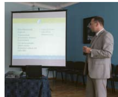
... и мэр города Калев Хярк.

Такие встречи решено проводить регулярно, как минимум раз в квартал. Следующая состоится сразу после того, как будут описаны промышленные зоны города, чтобы ознакомить предпринимателей с планами и возможностями развития этих зон.