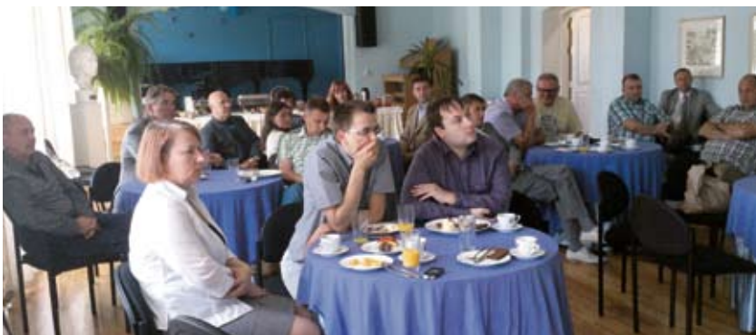
Предприниматели Валга ...

В связи с празднованием 430-летия получения городских прав в Валге прошли несколько встреч. Одно из нововведений — завтрак 4 июня у мэра с приглашением видных предпринимателей Валги. Его участники поговорили о том, как город и предприниматели могли бы объединенными усилиями развивать город так, чтобы здесь было комфортно жить всегда.