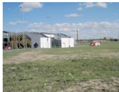
... ja nüüd.