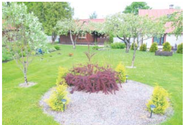
Perekond Parise koduaed.