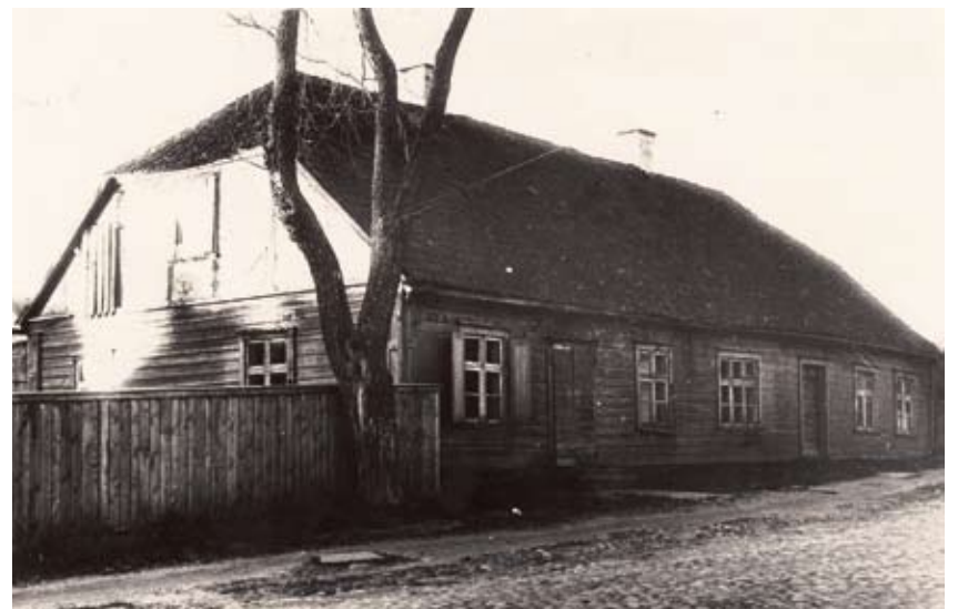
Важно отметить, что без Пеэтриской церковно-приходской школы город Валга не был бы таким, каким он сейчас является.