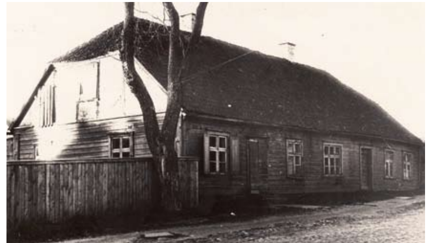
Valga Linna Peetri Kirikukool ehk Hans Eineri Kool oli eesti kultuuri teerajaja Valgas, ilma selle koolita ei oleks Valga see, mis on ta praegu.