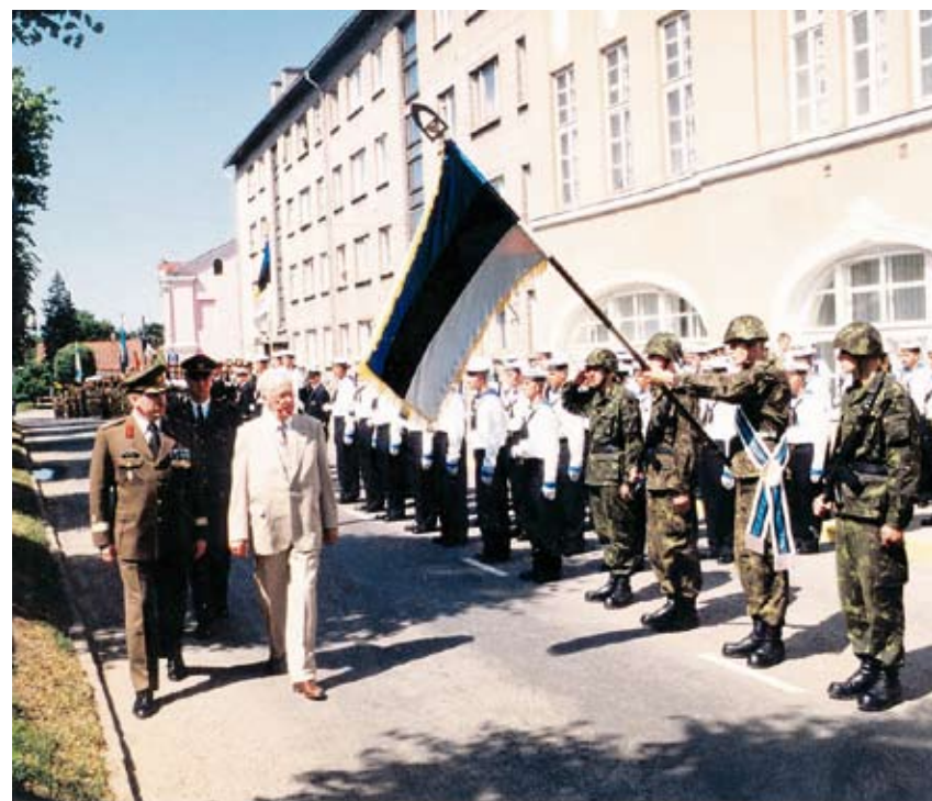
1999. gads, kad notika pirmā Brīvības cīņas godināšanas parāde. To pieņem tālaika Igaunijas prezidents Lennarts Meri.

Cēsu un Paju kauju apaļās gadskārtas atzīmēšana Valgā ar dažādiem pasākumiem notiks 22. un 23. jūnijā. Interesentiem lūgums sekot līdzī reklāmā. Pasākumu laikā gaidāmi arī satiksmes ierobežojumi, par ko tiks sniegta papildu informācija.