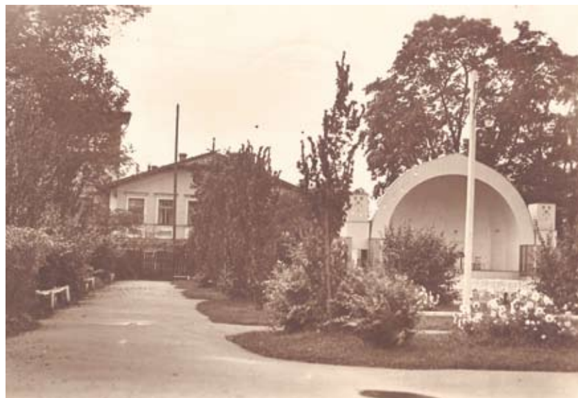
Säde aed ja kõlakoda 1929.