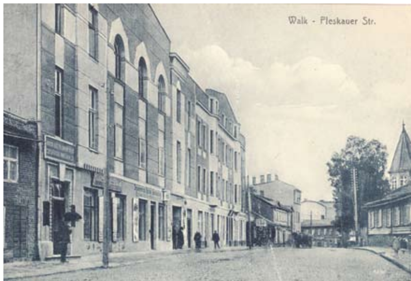
Säde maja seerifoto 1913.