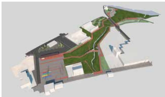
Joonis 1. Valga-Valka kaksiklinna keskuse projekti eskiislahenduse illustratsioon Sõpruse/Raina tänava suunast

Valga-Valka kaksiklinna keskuse arendamise projekt on saanud positiivse rahastusotuse Interreg Eesti-Läti piiriülese koostöö programmist aastateks 2014-2020. Projekti kogumaksumus on ligikaudu 3,5 mln eurot, millest 3 mln (85%) rahastatakse Eesti-Läti programmi abil. Projekt viiakse ellu koostöös Valga Kihelkonna Duumaga.