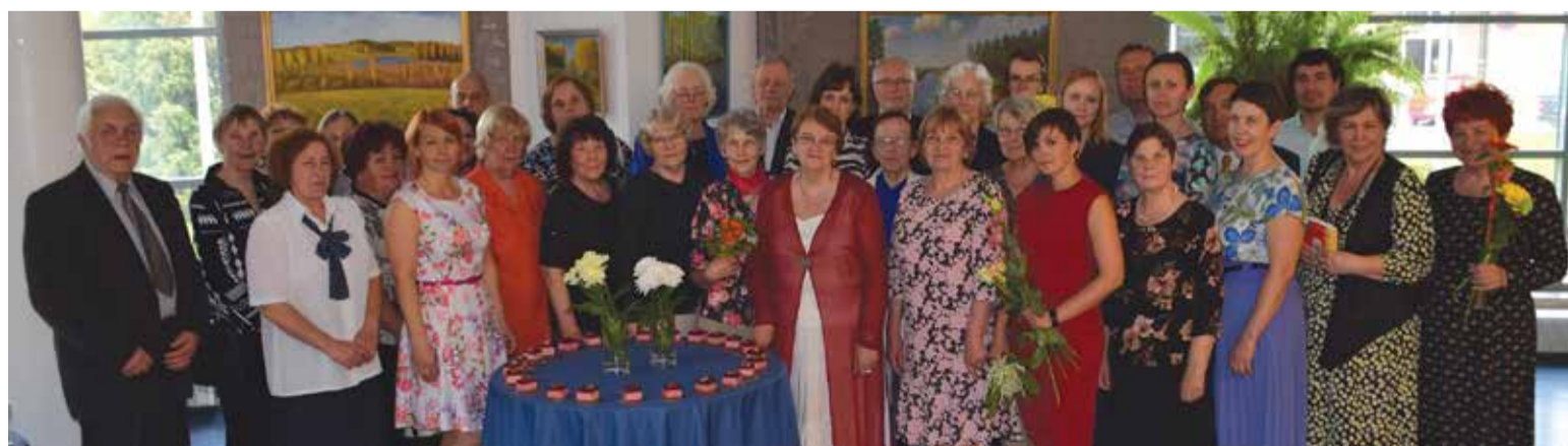
Valga muusikakooli kollektiiv