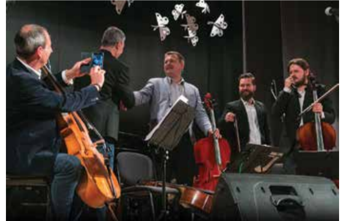
Valga muusikakoolis alustas sügisest tšelloõpetajana Vanemuise orkestris töötav tuntud tšellist Enno Lepnurm.

Lõppeval aastal toimus Valgas Lõuna-Eesti puhk-