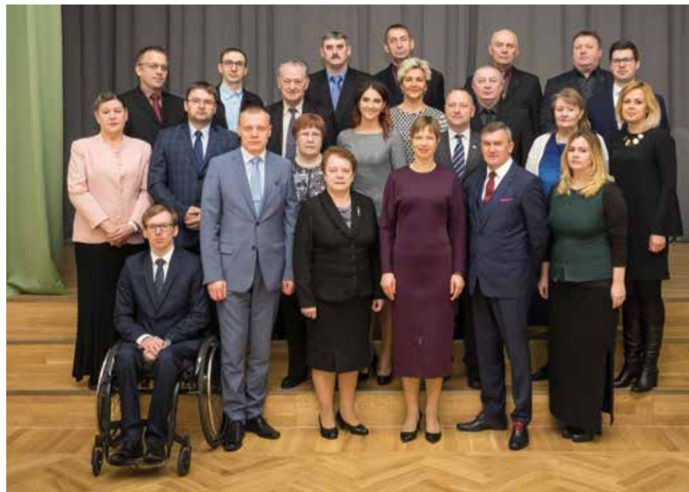
President Kersti Kaljulaid kohtus Valgas vallavolikogu ja vallavalitsuse liikmetega ning osales Schengeni viisaruumiga liitumise 10. aastapäeva tähistamisel.

puulehtede ja lehekottide äraveo abivajavale sihtgrupile; *) Vallavalitsus on seitsmeliikmeline, millest vallavanema ja kahe asevallavanema kohad kuuluvad Reformierakonnale ning kahe asevallavanema ja kahe vallavalitsuse liikme kohad Keskerakonnale. *) Koalitsiooni juhivad koalitsiooninõukogu. Volikogu töö korraldamiseks moodustati kuus alatist komisjoni: arengu- ja majanduskomisjon, rahanduskomisjon, sotsiaalkomisjon, kultuuri-, spordi- ja noorsootöökomisjon, hariduskomisjon ja korralduskomisjon. (Väljavõte, terviktekst: valga.ee)